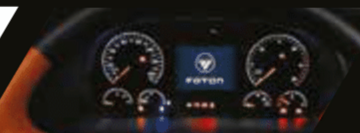
Panel de información