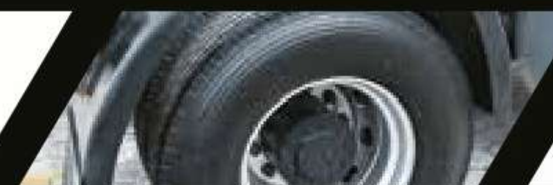
Eje con cubos reductores