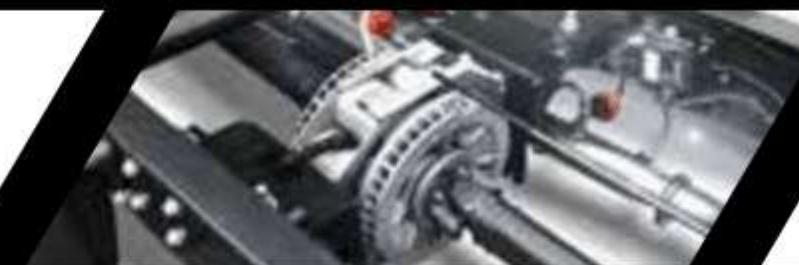
Freno de motor + Retardador