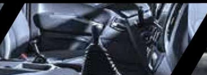
Caja ZF de 6 velocidades