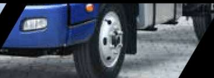
Frenos ABS + EBD