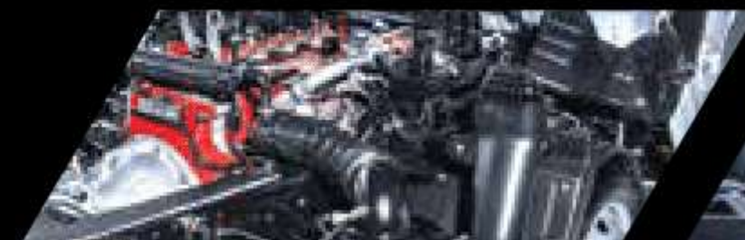
Motor Cummins ISF

GUAYAQUIL: Vía al Puente Alterno Norte Km 14 ½