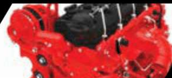
Motor Cummins ISF

GUAYAQUIL: Via al Puente Alterno Norte Km 14 ½