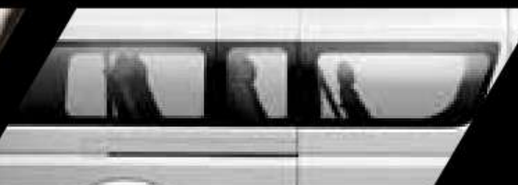
Asientos 17 pasajeros