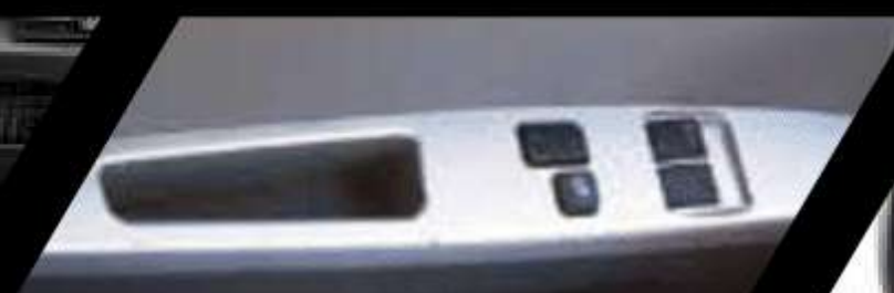
Vidrios eléctricos delanteros