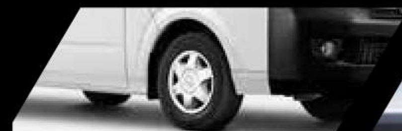
Frenos ABS + EBD

GUAYAQUIL: Vía al Puente Alterno Norte Km 14 ½