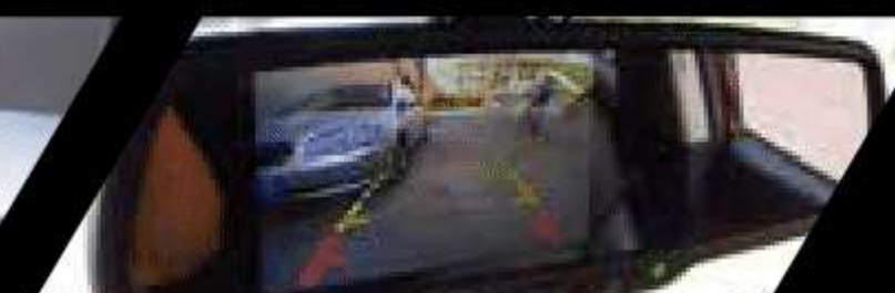
Cámara y sensor de retro