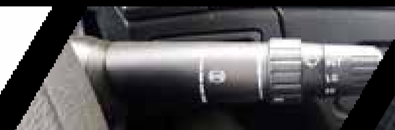
Freno de motor + Retardador